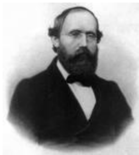
Bernhardas Riemannas (1826-1866).

Kalbant apie funkcijos sąvokos evoliuciją reikia pabrėžti, kad iki 19 amžiaus funkcija išreiškė tik realaus pasaulio sąryšius. Todėl buvo manoma, kad tik tolydžiosios funkcijos turėjo prasmę – aiškinant tuo, kad fiziniai objektai niekur nedingsta ir iš nieko neatsiranda. Šio funkcijos betarpiško siejimo su realiuoju pasauliu aiškiai ir sąmoningai atsisako B. Riemannas , ir tokiu būdu praveria duris į matematikos atsiskyrimą nuo gamtos mokslo, tuo metu dar vadinamo Gamtos filosofija.